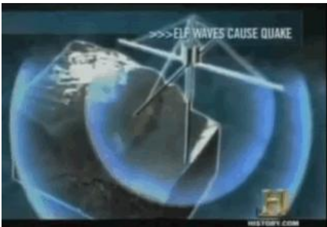
Von HAARP induzierte ELF-Wellen können Erdbeben auslösen

Und nun fragen Sie doch noch einmal, warum das ganze Aluminium in der Luft ist, das ganze andere Zeug jetzt mal aussen vorlassend, das sie ebenfalls Tag und Nacht mit ihren Chemtrails weltweit ausbringen. Um das Klima zu schützen? Sicherlich nicht, aber um die Menschen krankzumachen und um die Sonnenstrahlung ins All zurückzuwerfen mit all den negativen Folgen für alles Leben auf dem Planeten (25 Prozent weniger Sonnenlicht die letzten Jahrzehnte!) und um Geo-Engineering im grossen Stil betreiben zu können. Sage niemand, der Abschaum in den Parlamenten wüsste das nicht alles, während sie uns frech ins Gesicht lügen und vorgeben, das Klima "retten" zu wollen.